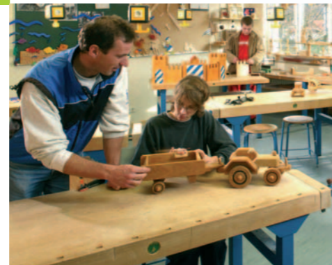
Werkräume und Internet-Terminal

Die Kosten der Reha-Maßnahme trägt Ihre LSV!